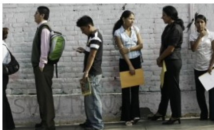
BM advierte los efectos de la recesión en el empleo juvenil (/impresa/economia/708781-bm-advierte-los-efectos-de-la-recesion-en-el-empleo-juvenil)

(/impresa/economia/708783-los-jovenes-de-beca-18-comparten-ideas-con-los-lideres-del-bm-y-fmi)