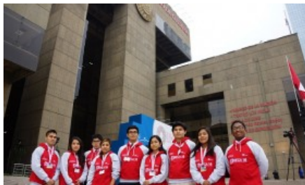
Los jóvenes de Beca 18 comparten ideas con los líderes del BM y FMI (/impresa/economia/708783-los-jovenes-de-beca-18-comparten-ideas-con-los-lideres-del-bm-y-fmi)

(/impresa/economia/708783-los-jovenes-de-beca-18-comparten-ideas-con-los-lideres-del-bm-y-fmi)